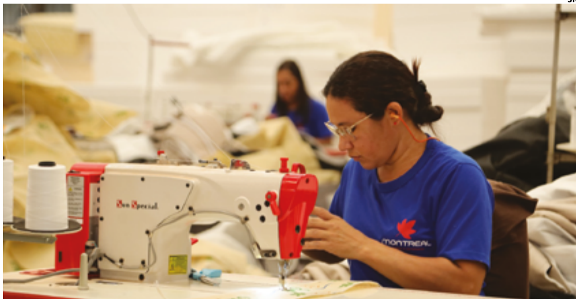
Atividades da indústria, do comércio e dos serviços colaboram para fortalecer a posição de liderança de Goiás

"A indústria, o comércio e os serviços têm consolidado Goiás como líder na geração de empregos na região Centro-Oeste,