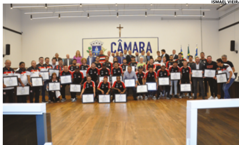
Foto oficial da entrega do Certificado com a presença de dezenas de torcedores tricolores