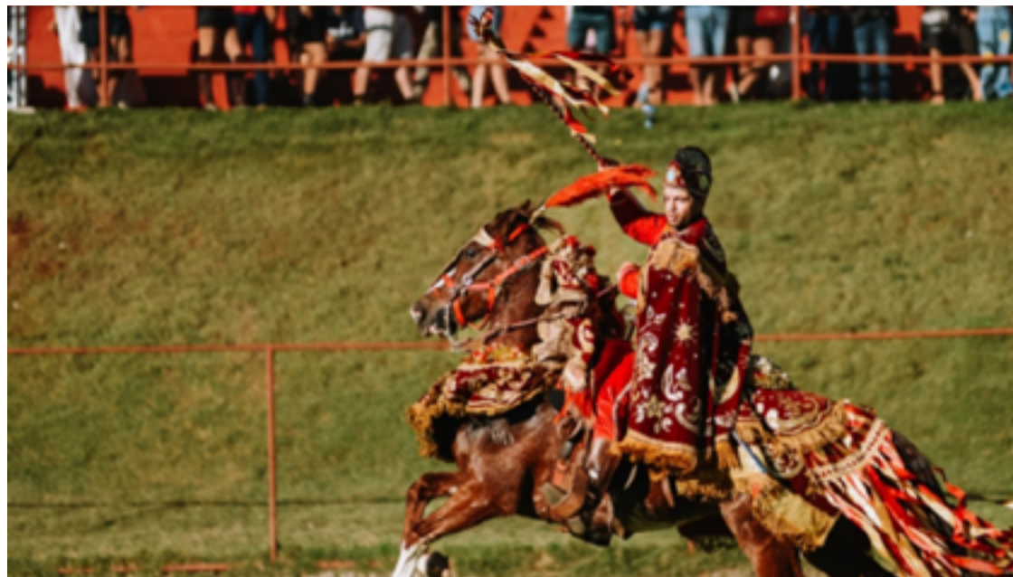
Circuito das Cavalhadas passa por Corumbá e Pilar de Goiás entre os dias 5 e 8 de setembro

Em Pilar de Goiás, o festejo alcança 129 anos de história e integra a Festa da Padroeira Nossa Senhora do Pilar. O ponto alto da programação acontece no sábado (7/9) e no domingo (8/9) às 15h. Os cavaleiros percorrem as principais ruas