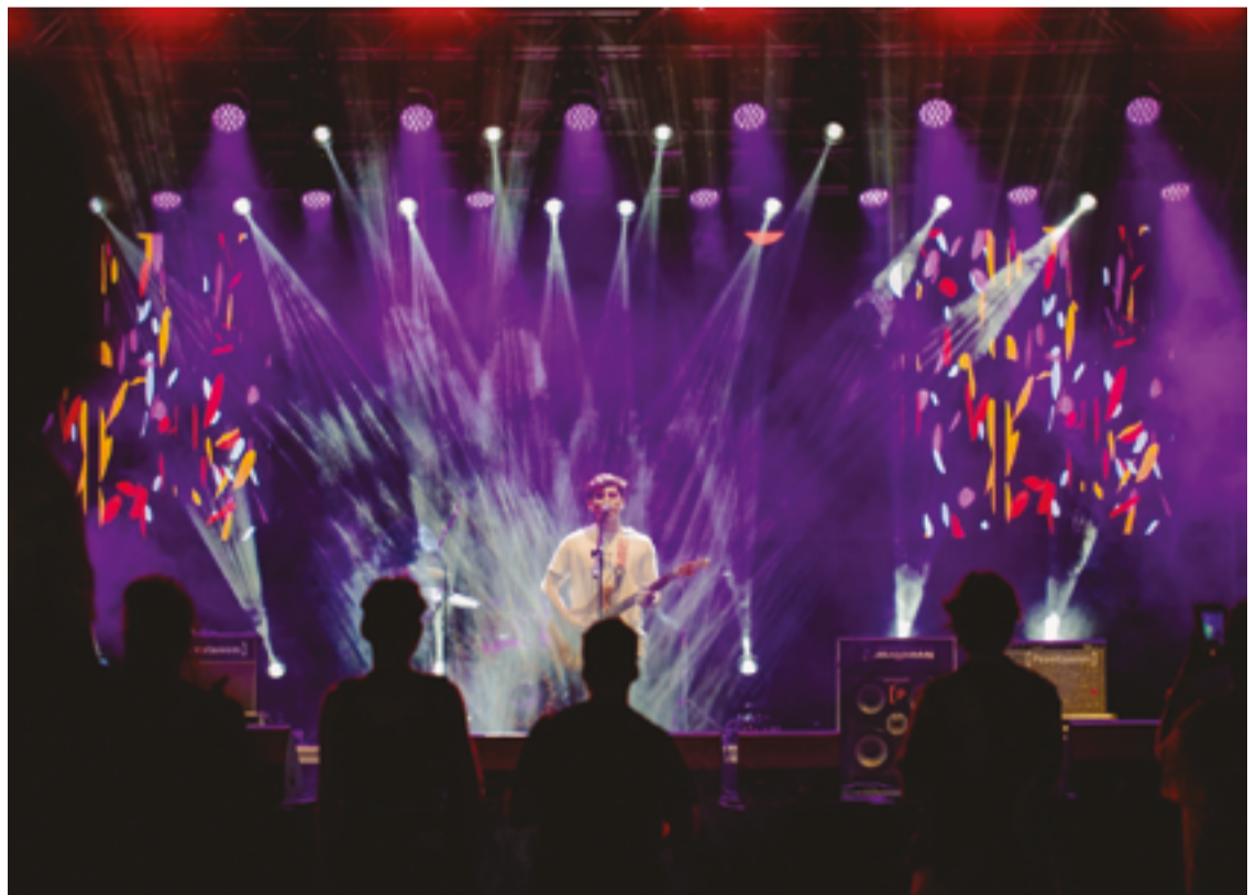
O Circuito Anapolino de Música é realizado em parceria pela Prefeitura Municipal e a E-live Produções Culturais

O 35º ENCOA busca promover e valorizar o canto coral, consolidando sua importância cultural e histórica em