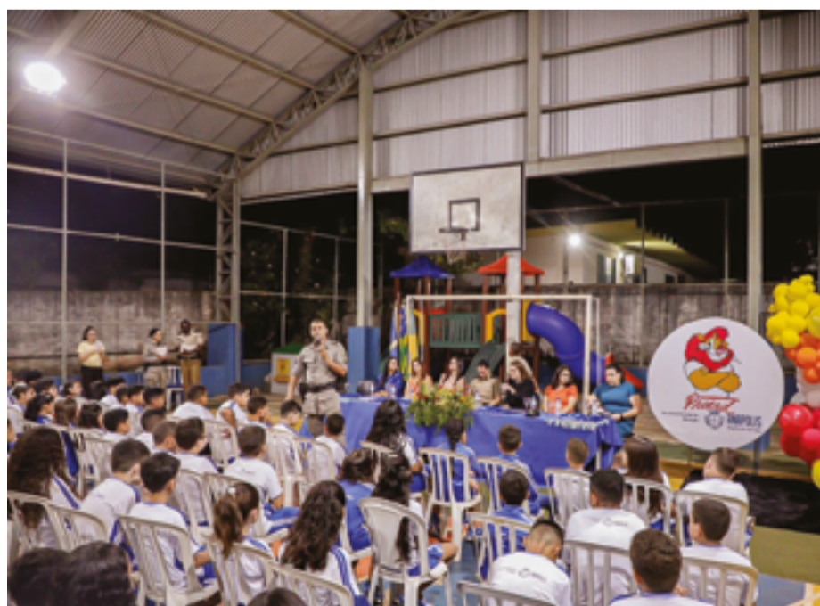
Finalidade do PROERD, entre outras, é prevenir uso de substâncias ilícitas e violência

REALIZA EMPREENDIMENTO ANÁPOLIS IV SPE LTDA