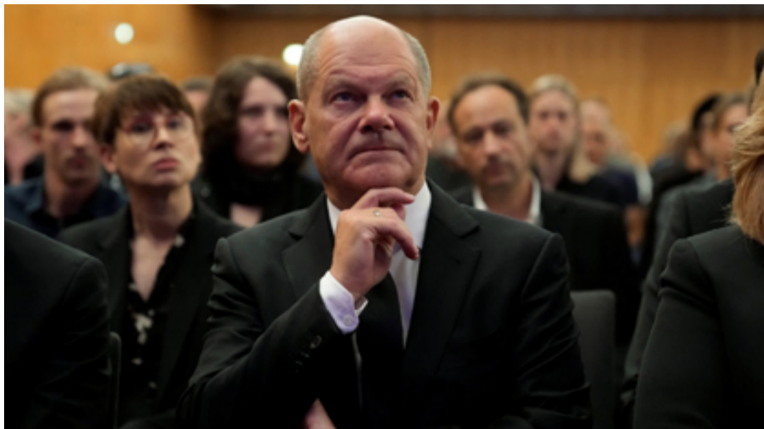
Avanço da direita ameaça fragilizar ainda mais a coalizão de centro-esquerda na Alemanha

Além da AfD, outro destaque foi o recém-criado partido BSW, de esquerda radical e anti-imigração, que obteve mais de 10% em ambos os estados. A fragmentação do cenário político deve dificultar a formação de governos estáveis nas duas regiões.