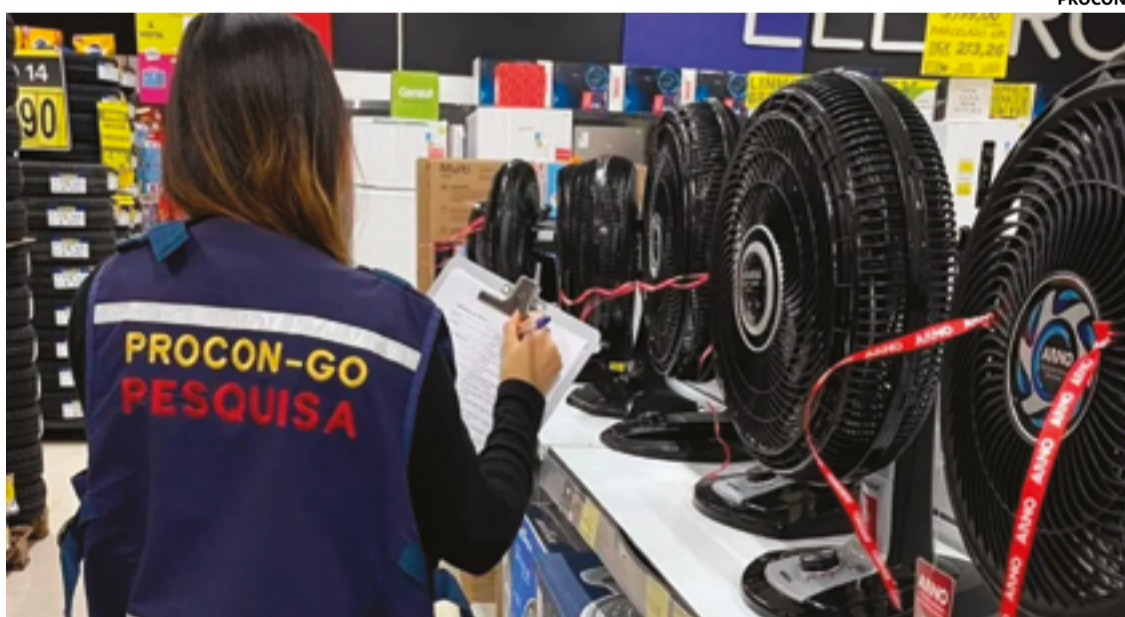
Órgão de defesa do consumidor avaliou os preços de 19 itens diferentes em seis lojas do município

Procon Anápolis, salienta que: “Ao fazer compras online, não esqueça de tirar print das telas e guardar os e-mails de confirmação de pagamento. Assim, você terá um registro completo