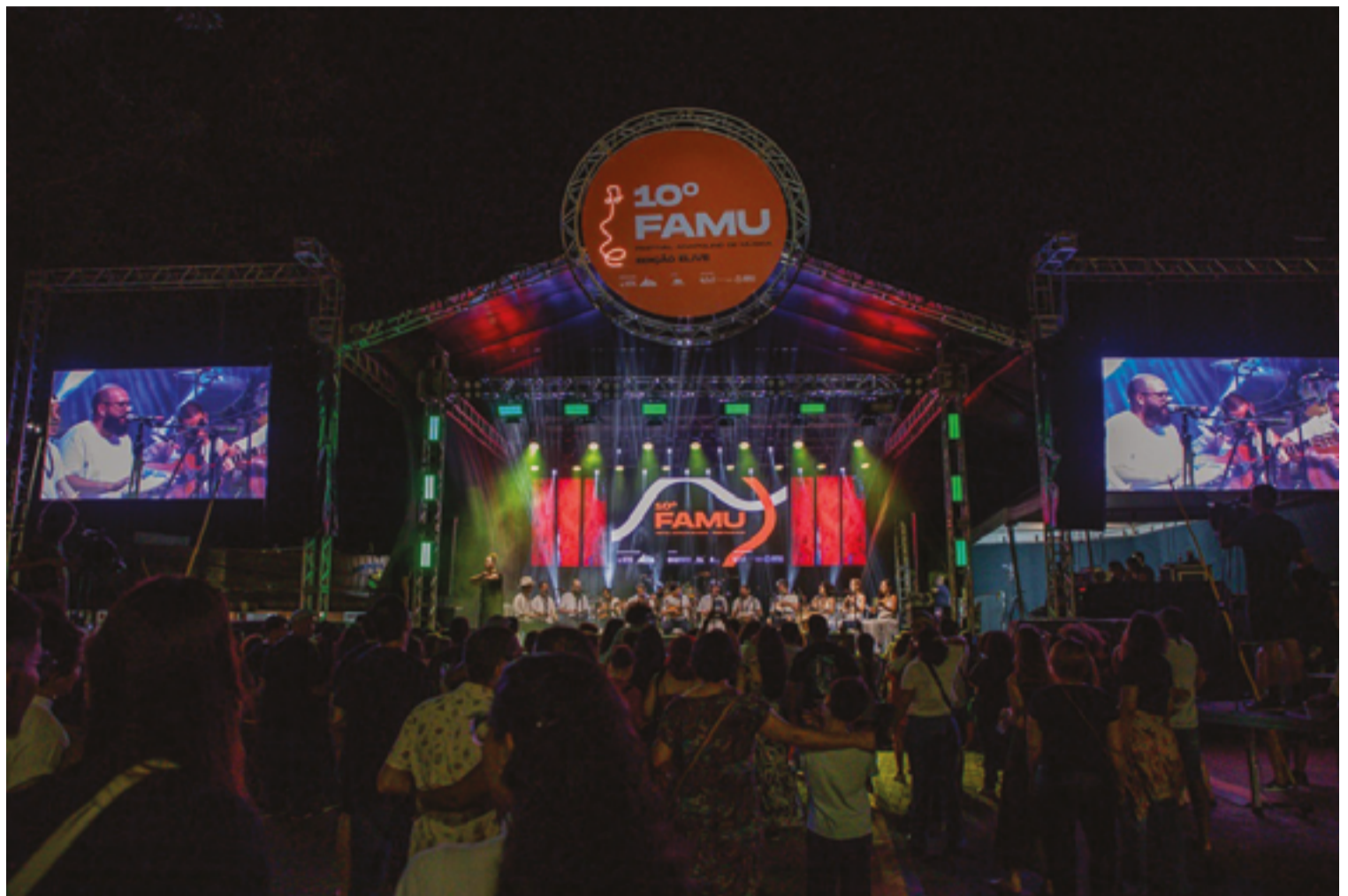
Evento agrega a realização de projetos como o 9º Festival de Viola, o 35º Encontro Nacional de Coros e o 11º Festival Anapolino de Música, o FAMU