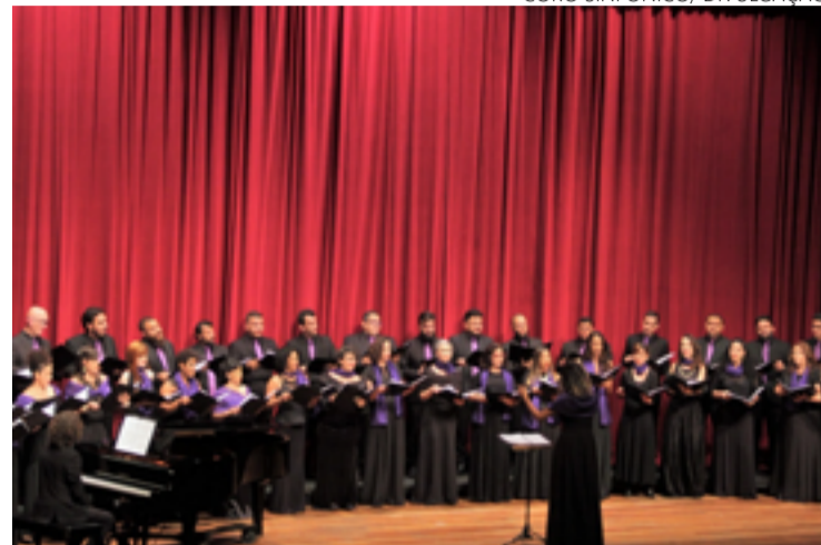
Coro interpreta repertório de inspiração religiosa