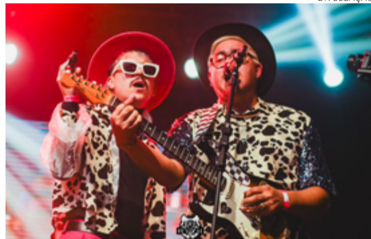
Banda Chorões da Pisadinha é considerada fenômeno