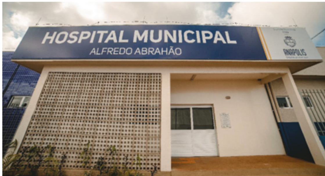
Gestora do HM Alfredo Abrahão, Funev também gere atenção básica, UPA Pediátrica e Centro Médico da Jaiara