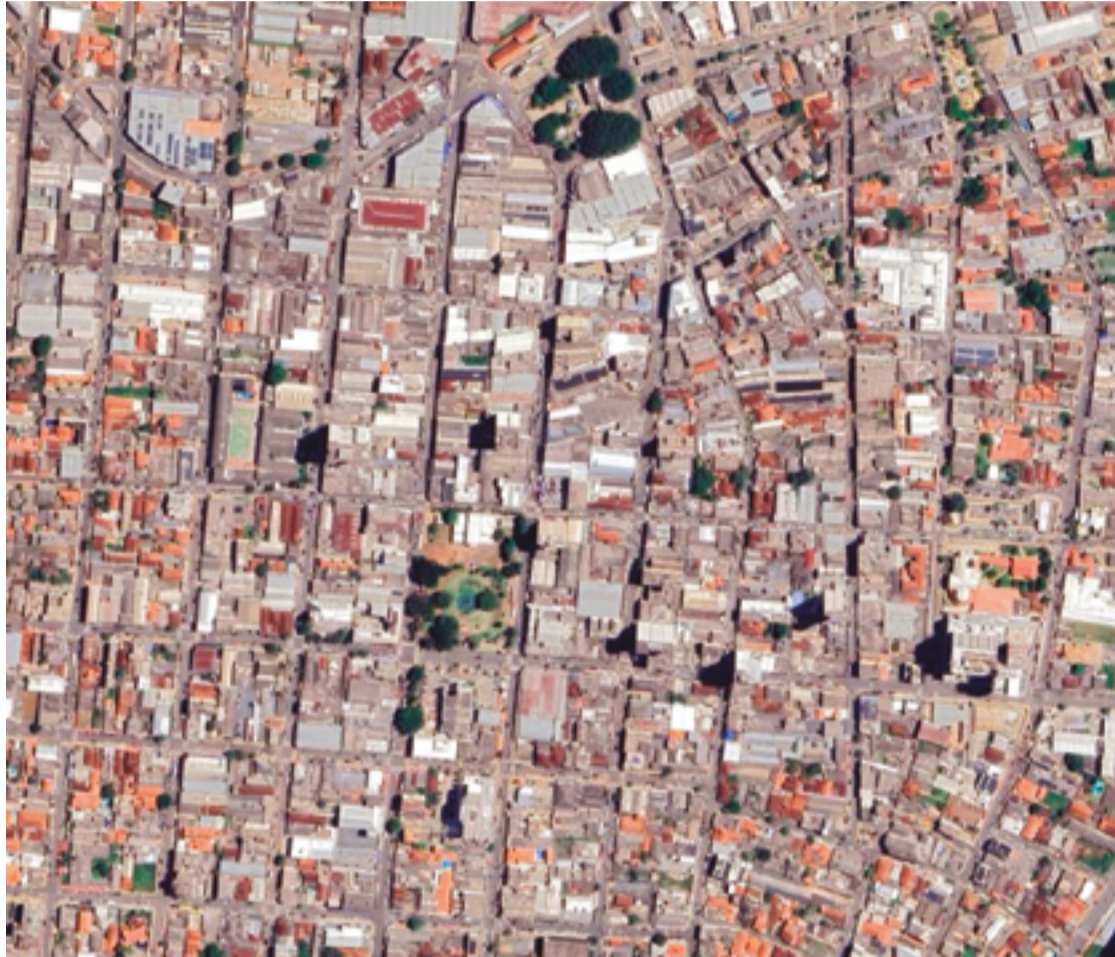
O espaço da cidade conhecido como quadrilátero central, a cada ano, se torna menos atrativo para o comércio

Eerizania promete finalizar a ponte estaiada e construir o anel viário que liga a BR-414 à BR-153. Uma novidade, caso ela seja eleita, é a construção do viaduto na interseção da