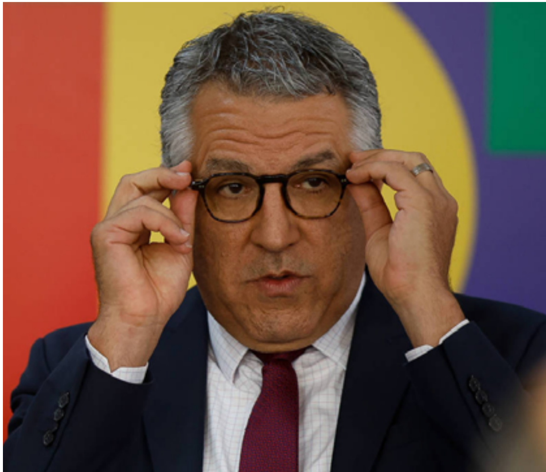
Alexandre Padilha: Lula vai atuar para enfraquecer o bolsonarismo em 2024

Além de candidatos filiados ao partido, candidatos de outras legendas que o PT tem apoiado também foram convidados para fazer fotos ao lado