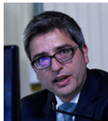
Carlos Portinho (PL/RJ): Congresso precisa agir contra o “destempero” de Alexandre de Moraes

Como mostrou a CNN, mesmo após o bloqueio do X, parlamentares da oposição seguem fazendo publicações na plataforma de Elon Musk.