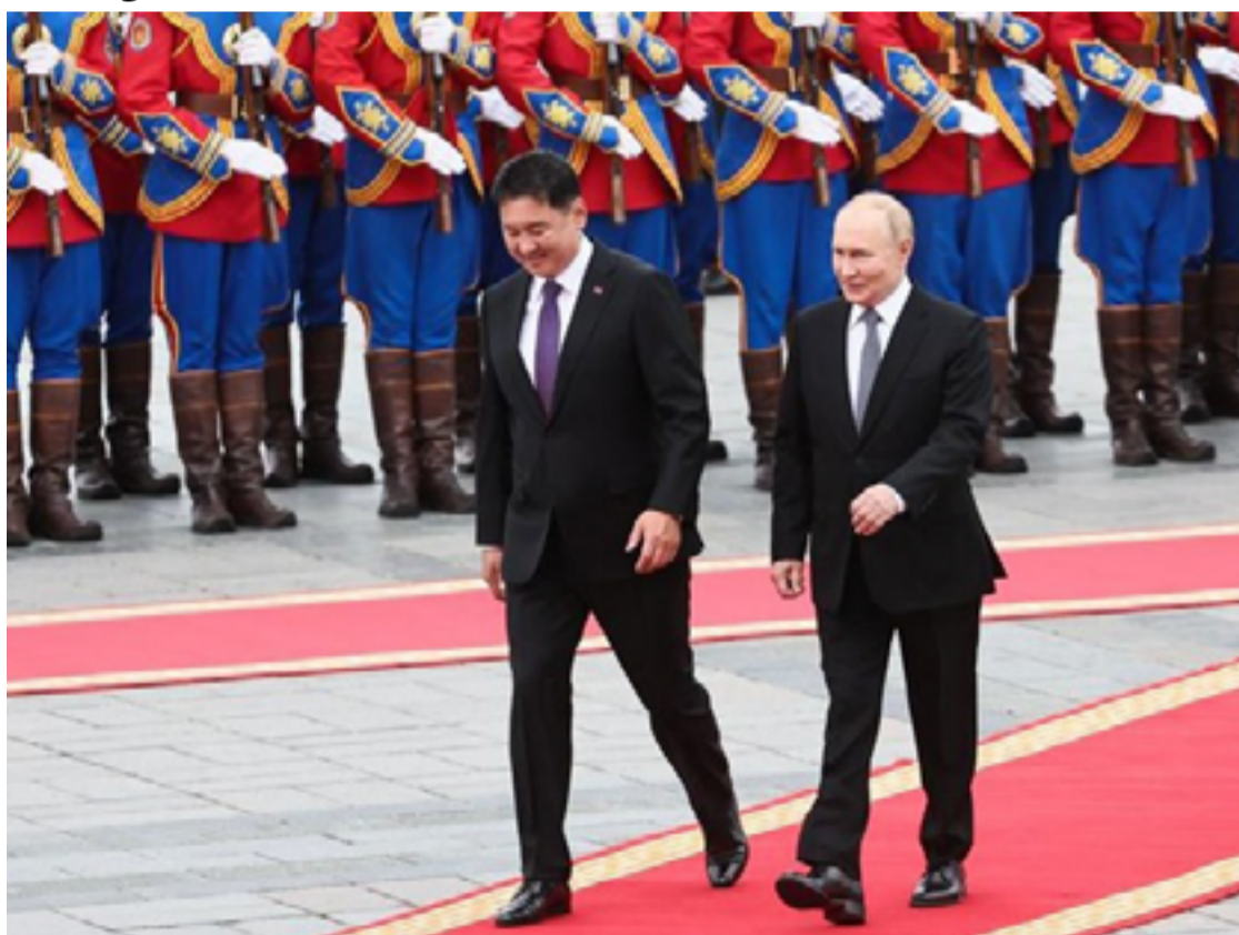
Vladimir Putin, presidente da Rússia, fez uma visita oficial à Mongólia

A visita coincidiu com o 85º aniversário da vitória das forças mongóis e soviéticas sobre o Japão imperial, um evento histórico que reforça os laços entre os dois países. A Mongólia, situada entre a Rússia e a China, enfrenta pressões geopolíticas significativas e busca equilibrar suas relações com esses vizinhos poderosos.