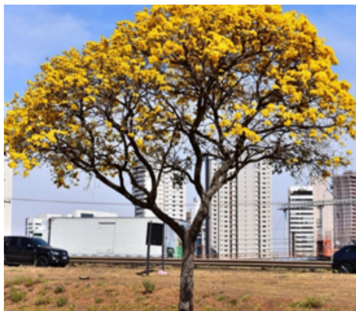
Floração de ipês dura cerca de cinco dias: espécie se espalha em setembro

As diferentes espécies de ipês não florescem simultane-